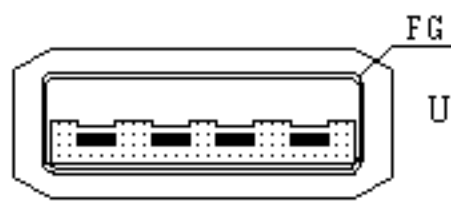
USB コネクタ Type-A オス